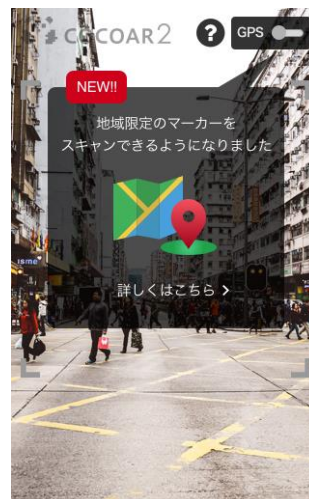
アプリ「COCOAR2」 閲覧範囲内の画面

COCOAR は企業向けの AR 制作ソフトです。紙媒体に任意の画像をマーカーとして設定し、スマホアプリ「COCOAR2」経由でマーカーをかざすと、AR コンテンツ(画像・テキスト・WEB・動画・3D・音楽・電子ブック)を閲覧することができます。導入した企業は自社サービスとして顧客に提供しており、現在、1,200 以上の主にクリエイティブ系企業に導入され、ログ解析が充実していることから販促・集客・情報配信ツールとして活用されています。