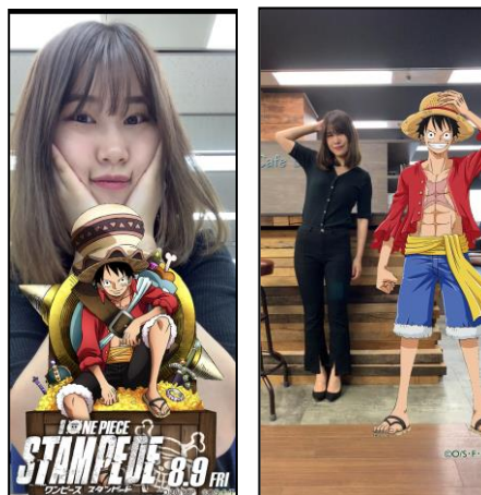
デジタルスタンプラリーで現れる ARのイメージ